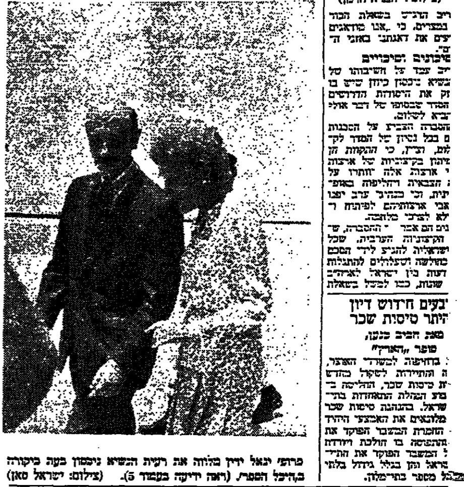
פרידו נאל ירון מלווה את רעייתו הנשיא ניכסון בעת ביקורה בקיבוץ המערבי (ראו דיוקן בעמדה 5)

התנועה הירוקה הודיעה כי תתנגד להקמת מתקני חשמל גרעיני במצרים. התנועה הירוקה הודיעה גם כי תתנגד להקמת מתקני חשמל גרעיני בישראל. התנועה הירוקה הודיעה גם כי תתנגד להקמת מתקני חשמל גרעיני במצרים, אך לא תתנגד להקמת מתקני חשמל גרעיני בישראל.